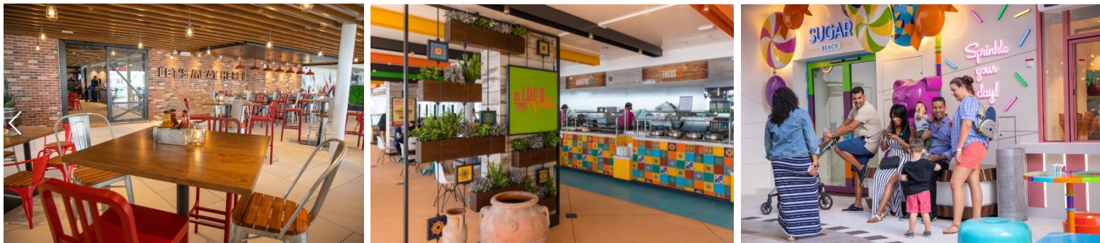
【左：ポートサイドBBQ、中央：エル ロコ フレッシュ、右：シュガービーチ】