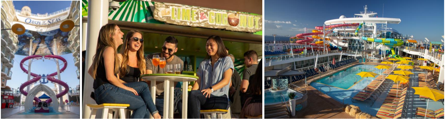
【左：アルティメットアビス、中央：ザ・ライムアンドココナッツ、右：改装後のプールデッキ】