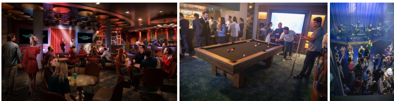
【左：スポットライトカラオケ、中央・右：ミュージックホール】